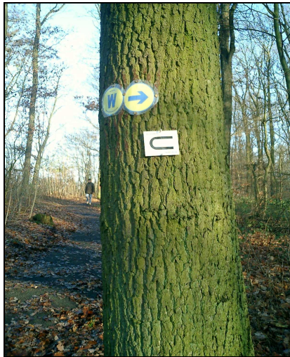
Markierung der Wanderwege